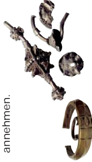
Barren, Ringe, Stäbe oder Schmuckstücke: Hacksilber konnte verschiedene Formen annehmen.