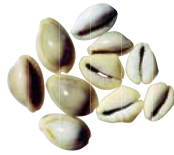
Die Kaurimuschel war als Zahlungsmittel in ganz Ostasien verbreitet.