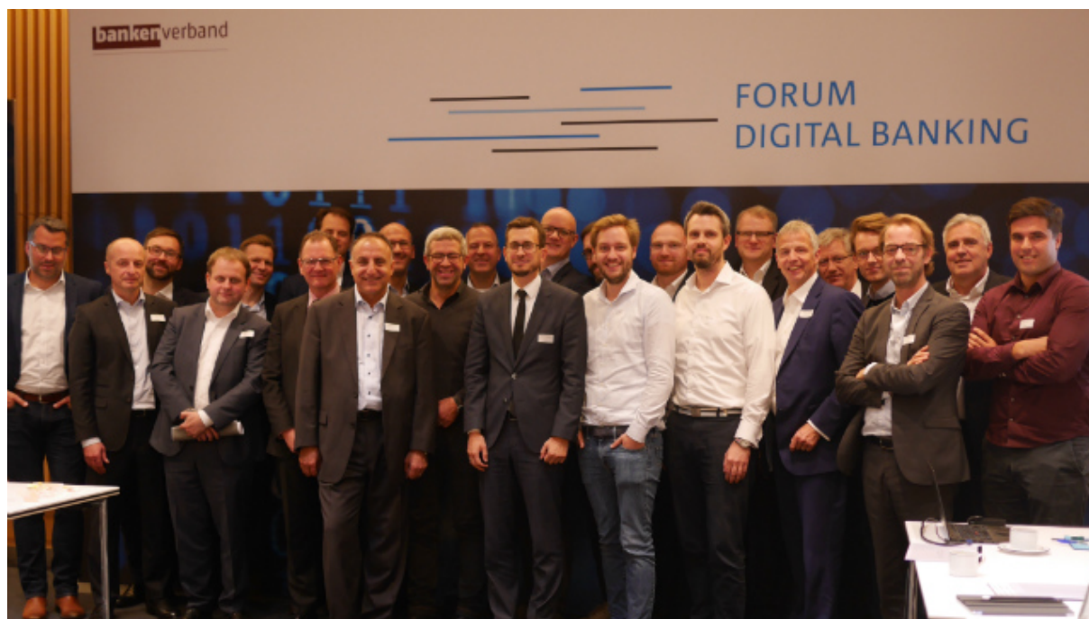
Die Mitglieder nach der konstituierenden Sitzung.