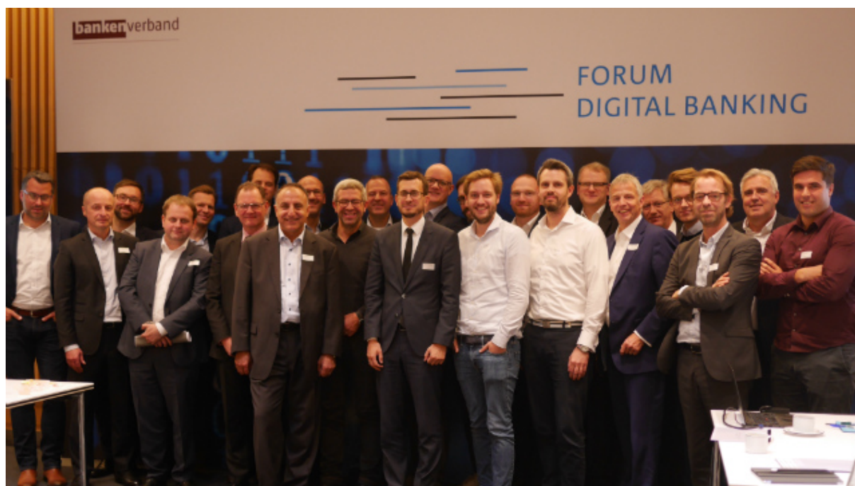
Die Mitglieder nach der konstituierenden Sitzung.