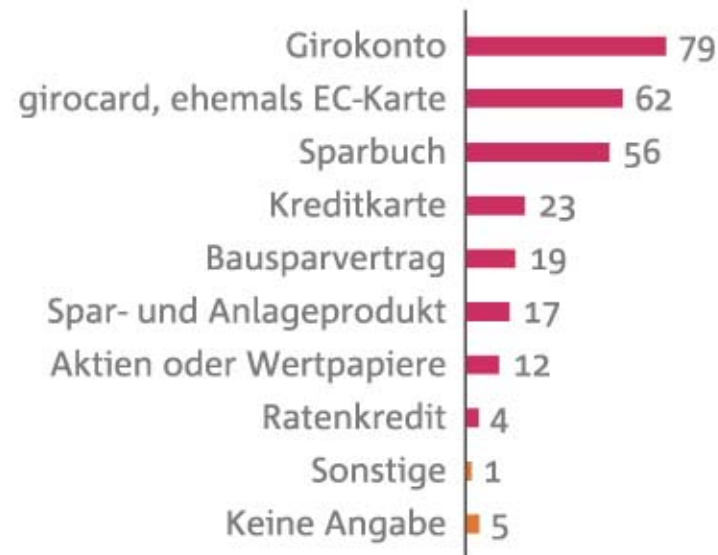
Nutzung von Finanzprodukten

Frage T: Bitte nennen Sie uns, über welche der folgenden Finanzprodukte Sie persönlich verfügen. Basis: n=651 inkl. k.A.; Angaben in Prozent und Nennungen ab 1% dargestellt