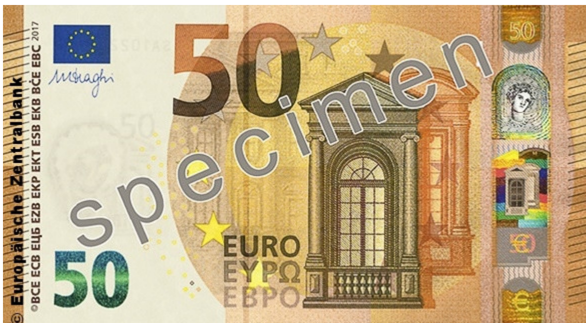
50-Euro-Schein aus der Europa-Serie