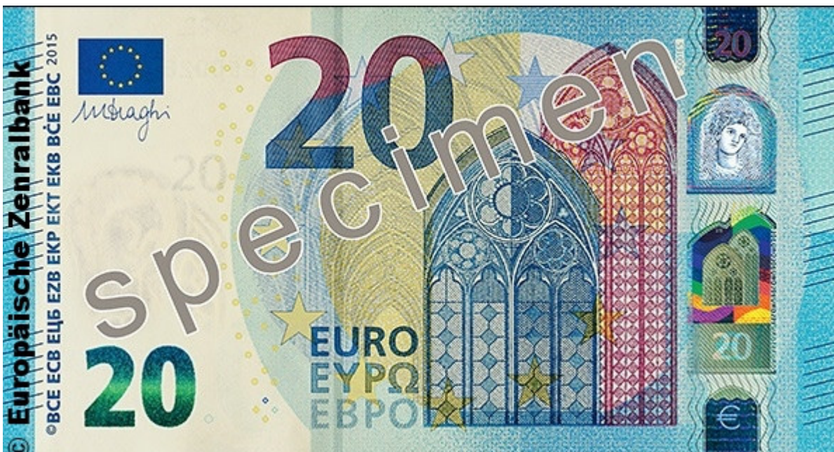
20-Euro-Schein aus der Europa-Serie