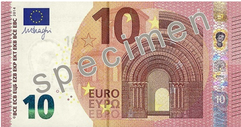
10-Euro-Schein aus der Europa-Serie

Hier sehen Sie, wie der 10er, 20er und 50er Schein der Europa-Serie aussieht.